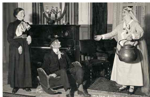
näytelmästä Miehen kylkiluu

Kahvipapuja ostettiin kahvikaupoista irtokahvina, joka oli raakakahvia (Alli Karvisen kahvikauppa, Minna Canthin ja perillisten kahvikauppa). Vielä vihertävät kahvin pavut lajiteltiin, pestiin (kuivattiin vaatteiden sisällä) ja paahdettiin vaalean ruskeiksi ennen kuin niistä jauhettiin kahvijauhoa.